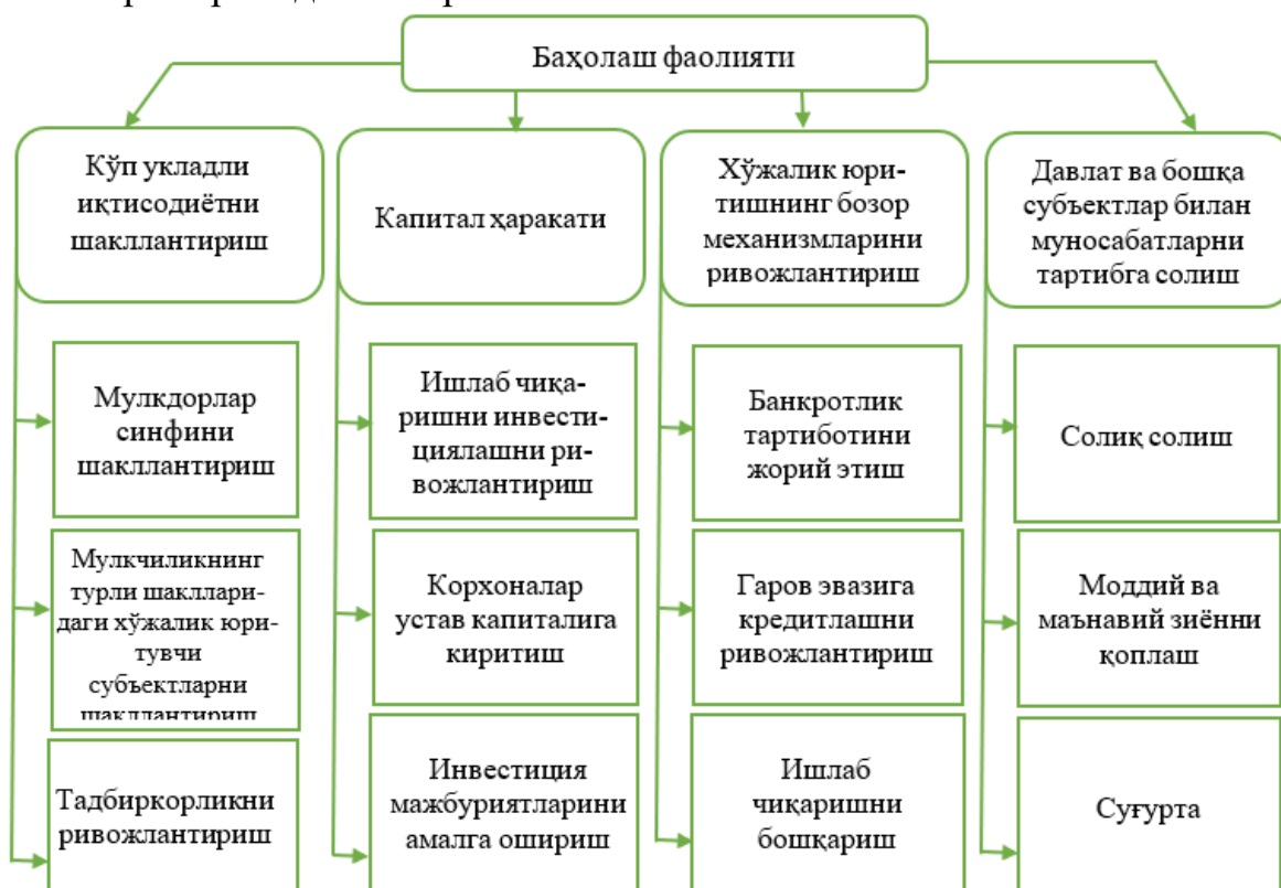
1-расм. Баҳолаш фаолиятининг бозор иқтисодиётининг шаклланиши ва ривожланишидаги иштирокининг асосий йўналишлари

Замонавий баҳолаш фаолияти бозор муносабатларини ва кўп укладли иқтисодиётни ривожлантириш, хўжалик юритишнинг бозор механизмларини такомиллаштириш, капитал ҳаракати ва бозорларнинг очиқлиги, хўжалик юритувчи субъектларнинг давлат билан ўзаро муносабатларини тартибга солишнинг зарур шарти ҳисобланади. Баҳолаш фаолиятининг бозор иқтисодиётининг шаклланиши ва ривожланишидаги иштирокининг асосий йўналишлари 1-расмда келтирилган.