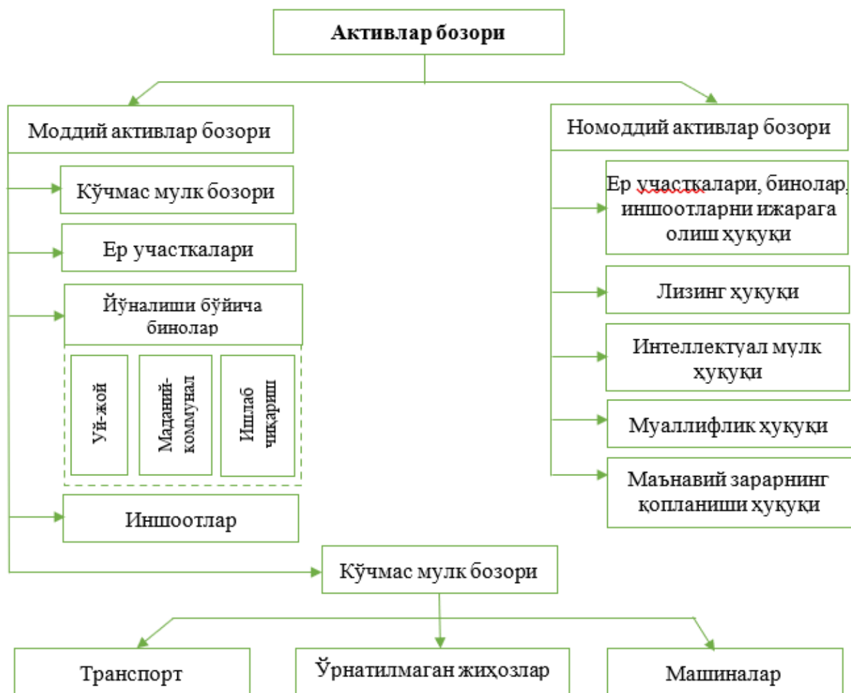
3-расм. Бозор иқтисодиёти шароитида оборотга жалб этиладиган асосий моддий ва номоддий асосий фондлар

Ўзбекистон Республикасининг иқтисодиётини ислоҳ қилиш, унинг кўп укладлилигини шакллантириш, тадбиркорликни ривожлантиришнинг ҳозирги жараёнлари маҳаллий шароитга мослаштирилган усуллари назарий жиҳатдан ишлаб чиқиш ва бу борадаги тажрибани илмий жиҳатдан умумлаштириш, баҳолаш тузилмаларини халқаро касаба ҳамжамиятларига босқичма-босқич интеграциялаш ва баҳолаш ишларини халқаро баҳолаш стандартларининг талабларига мувофиқ амалга оширишга изчил ўтказиш йўллари ўрганиш билан узвқий боғлиқ. Буларнинг барчаси, пировардида, баҳолаш фаолиятини тартибга солиш ва бошқаришни такомиллаштириш заруратини келтириб чиқаради. Бозор иқтисодиёти ривожланишининг зарур шarti сифатида асосий фондлар қийматини баҳолаш турли асосий фондлар обороти ва улардан фойдаланишда иштирок этиши керак. Уларнинг асосийлари 3-расмда келтирилган.