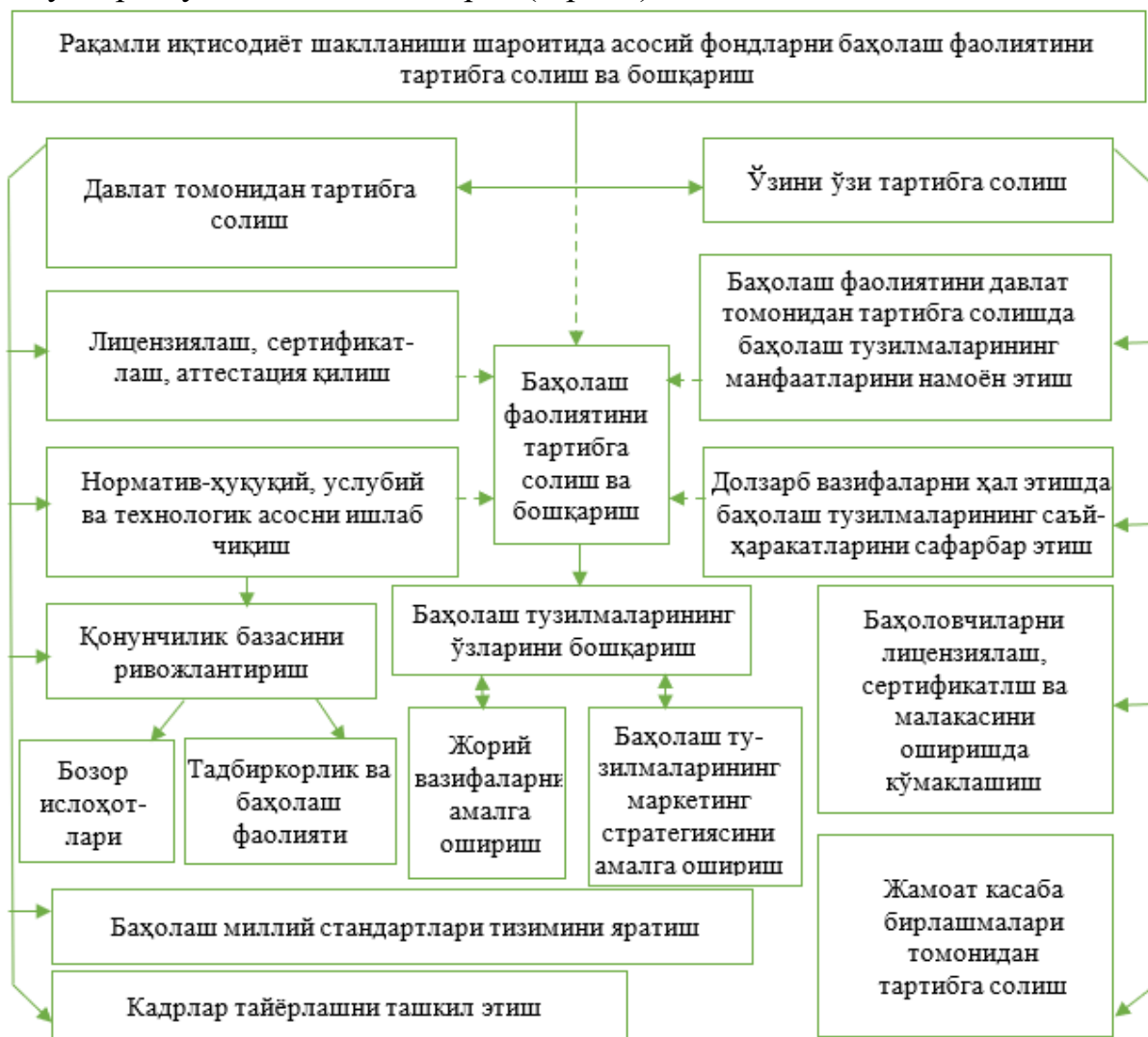
2-расм. Рақамли иқтисодиёт шаклланиши шароитида асосий фондларни баҳолаш фаолиятини тартибга солиш ва бошқариш

Баҳолаш фаолиятининг бозор иқтисодиётини ривожлантиришдаги иштирокининг кўп режавийлиги давлатнинг баҳолаш корхоналари мустақиллигининг юқори даражасини таъминлаш билан бирга уни (баҳолаш фаолиятини) тартибга солиш ва бошқаришнинг самарали механизмини яратиш ҳамда ривожлантиришдан манфаатдорлигини белгилаб беради. Бозор иқтисодиёти шароитида бундай уйғунлаштириш қатор принципиал ёндашувларни ўз ичига олиши керак (2-расм).