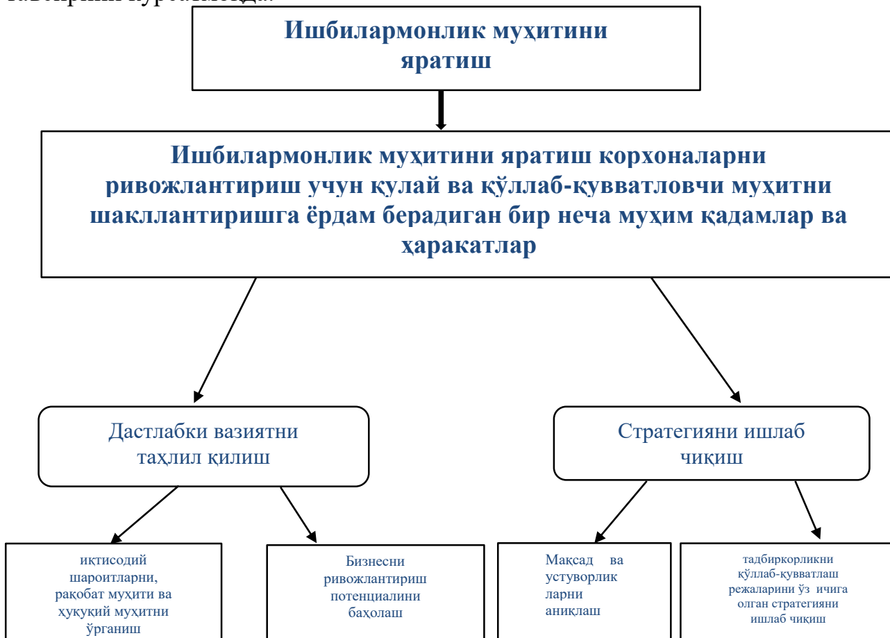
1-расм. Рақамли иқтисодиёт шароитида ишбилармонлик муҳитини яратиш жараёнига киритилган асосий қадамлар [21]

Шу билан бирга, эътироф этиш керакки, иқтисодиёти барқарорлашиб борган ҳар бир мамлакатда ишбилармонлик муҳитининг тобора ривожланишига рақамли иқтисодиётнинг таъсир кўлами сезиларлироқ бўлиб бормоқда. Айниқса глобал ривожланаётган иқтисодий муносабатлар тобора кўпроқ виртуал муҳитда амалга оширилмоқда, бу эса жаҳон иқтисодиётининг ривожига ўзининг ижобий таъсирини кўрсатмоқда.